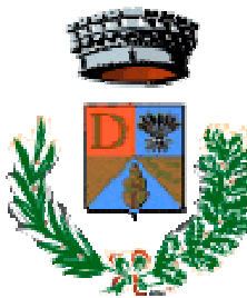
Comune di Decimoputzu