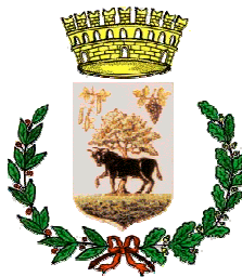
Comune di Musei