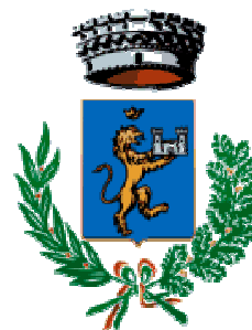
Comune di Villamassargia