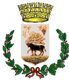
Comune di Musei