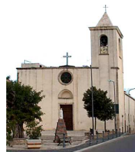
Comune di Vallermosa