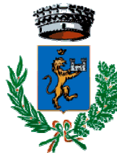
Comune di Villamassargia