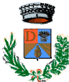
Comune di Decimoputzu