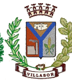
Comune di Villasor