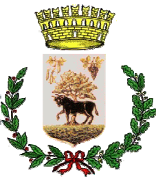
Comune di Musei