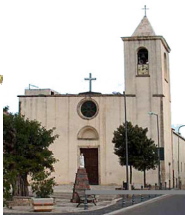
Comune di Vallermosa