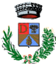
Comune di Decimoputzu