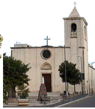
Comune di Vallermosa