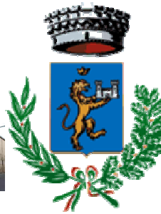
Comune di Villamassargia