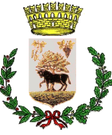
Comune di Musei